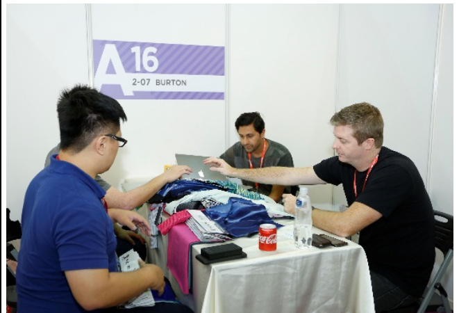
TITAS 2017 一對一採購商洽會