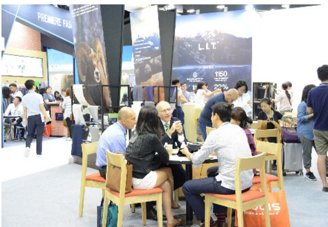
國際買主與參展商洽談