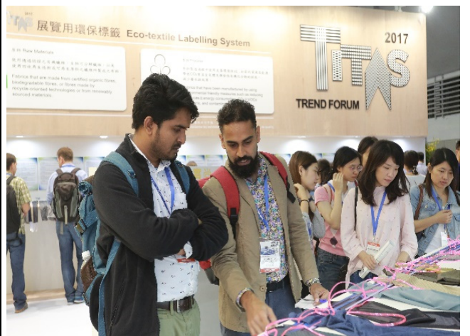
TITAS 2017 形象區人潮