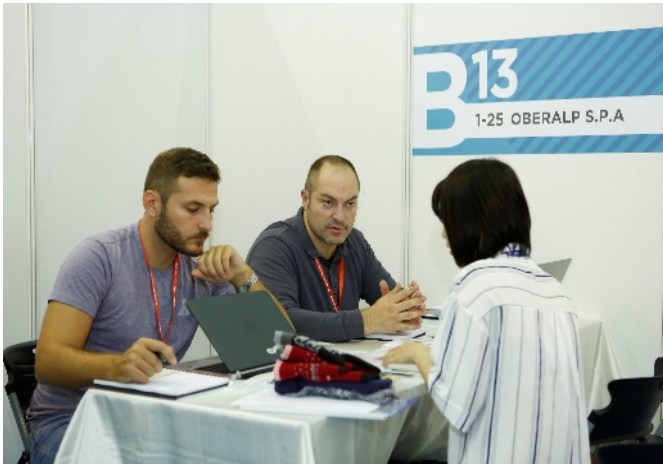
TITAS 2017 一對一採購商洽會