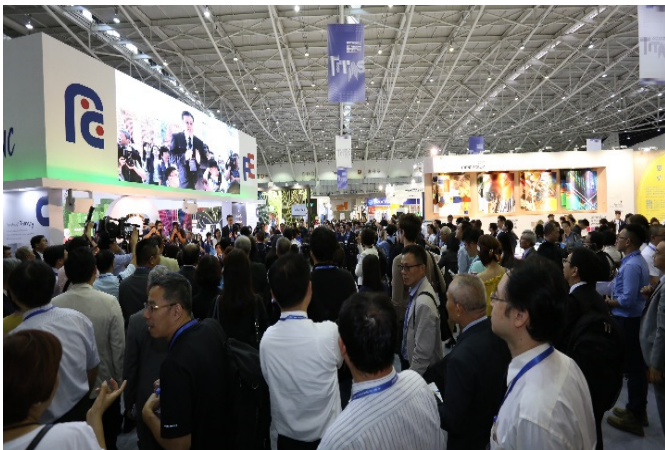
TITAS 2017 參觀人潮