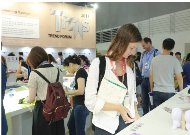
TITAS 2017 形象區人潮