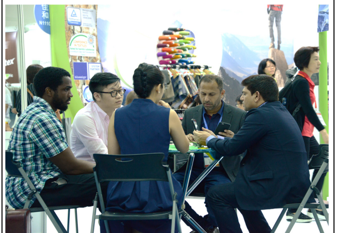
國際買主與參展商洽談