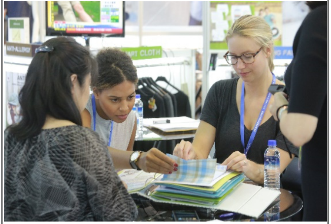
國際買主與參展商洽談