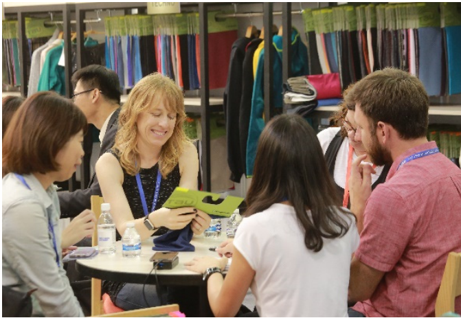
國際買主與參展商洽談