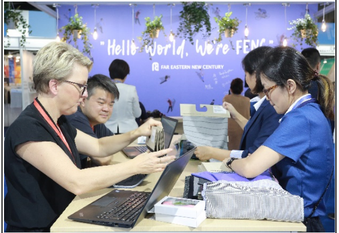
國際買主與參展商洽談