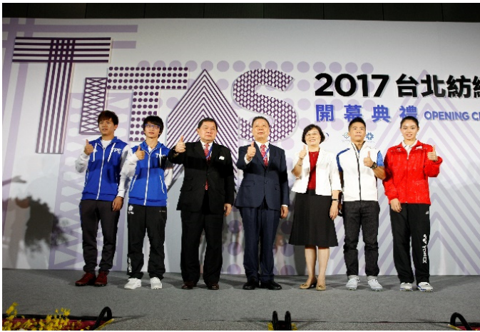
楊局長、詹董事長、徐董事長及運動健將們 為台灣紡織產業按讚